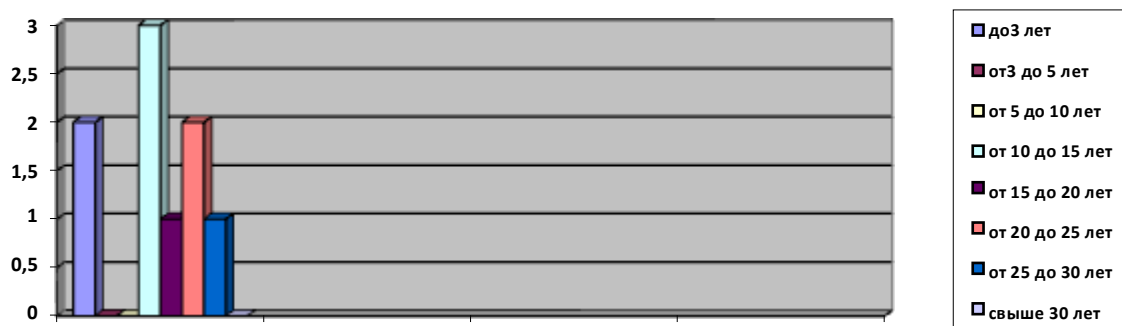
Диаграмма с характеристикой стажа педагогической работы

В течении 2021 года педагоги СП приняли участие: