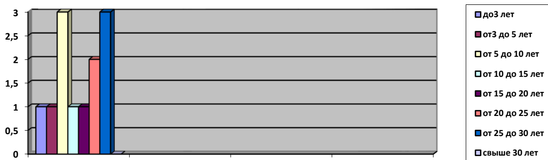
Диаграмма с характеристикой стажа педагогической работы

В течении этого учебного года педагоги сп приняли участие: